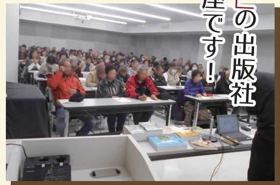
過去の講座の様子