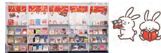
前回の展示の様子

＜企画＞バレンタイン、スタッフおすすめ本 ＜一般＞新書フェア～新書だけを集めました～ ＜児童＞おにの本、MOEの本 ＜予約棚前＞岡山プロスポーツチームを応援！ 選手オススメの一冊