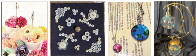
フラワーメモスタンド ボタンアート UVレジンペンダント ディンブルアート

場所 ギャラリー ※申込み不要 料金 500円～ 講師 スタジオ TOMA 大賀 敏江氏 ほか