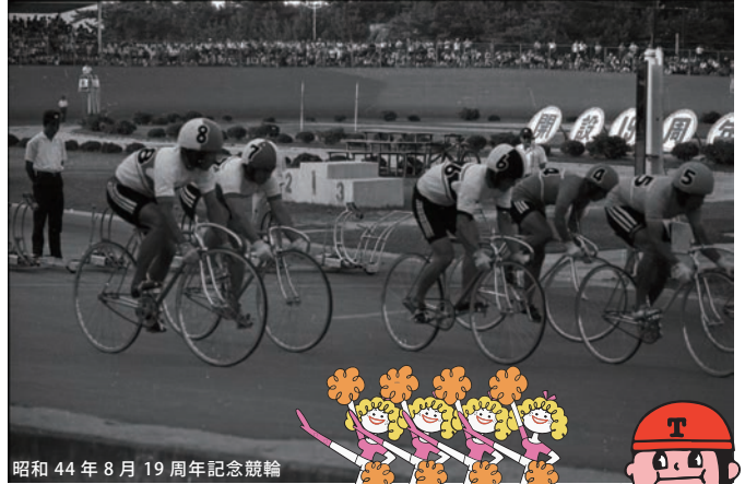
昭和44年8月19周年記念競輪