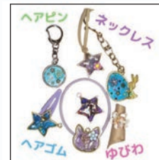
レジンキーホルダー