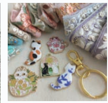
インド刺繍リボンで ヘアクリップ作り 他