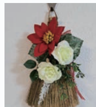
クリスマススワッグ