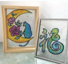
ディンプルアート干支 他