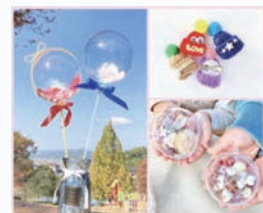
ニット帽のミニブローチ 他