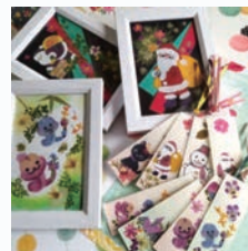
押し花アート菜 他