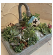
多肉植物の寄せ植え