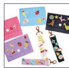
ワッペンでデザイン