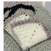
かぎ針でコットンハンカチーフ