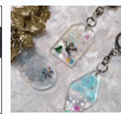
UVレジンでキーホルダー作り