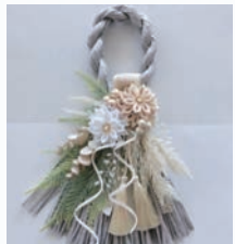
畳の縁のお飾り作り