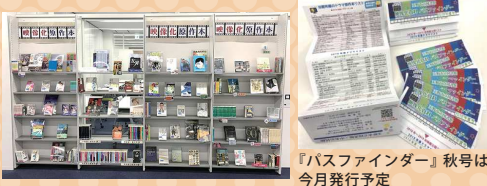
『バスファインダー』秋号は 今月発行予定

この度、映画化原作本やドラマ化原作本を集めた『映像化原作本』コーナーがスペース2倍にグレードアップしてリニューアル!今話題の旬の映画、これから始まる秋ドラマの原作本など充実のラインナップで展示中です!