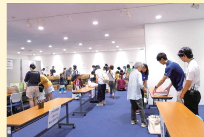
本の持ち帰り冊数を数えている様子